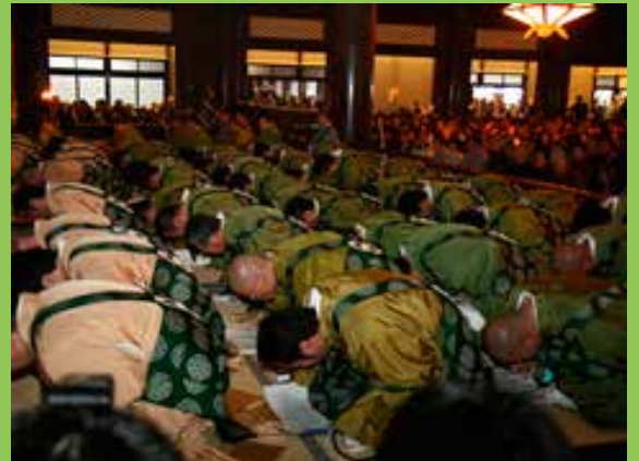
毎年の本山報恩講御満座では体を前後左右に動かすダイナミックな坂東曲が勤まります